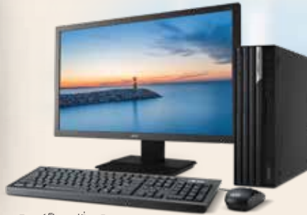
จอมอนิเตอร์เป็นอุปกรณ์เสริม

Free - ASM System Management (มูลค่า 3,000.-)