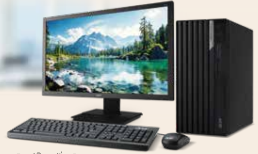
จอมอนิเตอร์เป็นอุปกรณ์เสริม

Free - ASM System Management (มูลค่า 3,000.-)